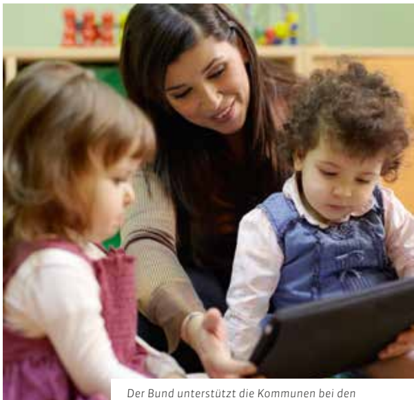
Der Bund unterstützt die Kommunen bei den Kita-Betriebskosten.

Bessere Schulen, intakte Straßen, eine gute Kinderbetreuung und schnelle Internetverbindungen – wir erwarten eine hohe Lebensqualität in unserem direkten Lebensumfeld. Viele Städte und Gemeinden sehen sich aber nicht mehr imstande, diese Aufgaben zu erfüllen. Die SPD-Bundestagsfraktion hat 2013 im Koalitionsvertrag durchgesetzt, dass die Kommunen in dieser Legislaturperiode deutlich finanziell entlastet und ihre Handlungsspielräume erhöht werden. Eine Reihe von Maßnahmen haben wir bereits im ersten Regierungsjahr beschlossen.